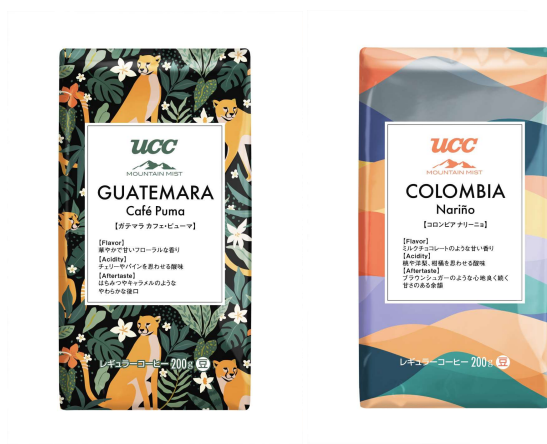
（左から）『UCC MOUNTAIN MIST ガテマラ カフェ・ピューマ（豆）200g』 『UCC MOUNTAIN MIST コロンビア ナリーニョ（豆）200g』製品パッケージ

UCC グループで業務用サービス事業を展開する UCC コーヒープロフェッショナル株式会社（本社：東京都港区、社長：川久保 則志）は、世界のコーヒー農園とお客さまをつなぐ業務用スペシャルティコーヒーシリーズ『MOUNTAIN MIST』から、サステナブルなコーヒー農園経営支援につながる『ガテマラ カフェ・ピューマ』と生産者までトレース可能な『コロンビア ナリーニョ』の2品を期間限定で9月2日（月）に発売いたします。