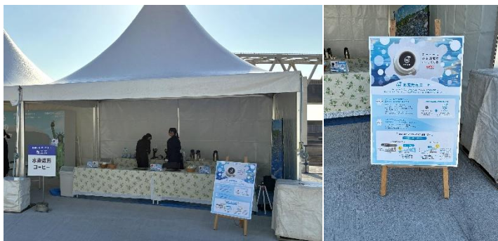
▲ 起工式での UCC 水素焙煎コーヒー提供の様子

また、7～8 月には、東京と神戸で開催した親子向けサステナビリティセミナー「コーヒーと SDGs for キッズ」にてコラボレーションセミナーを実施するなど、川崎重工と UCC グループは水素を共通言語に連携を深めています。